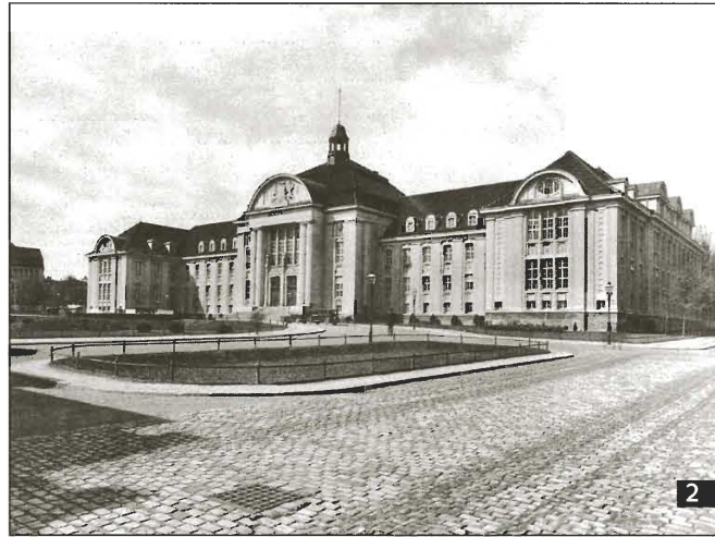
2 Das Schweriner Justizgebäude, um 1930.