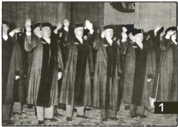
1 Richter einer Strafkammer erheben ihre Hand zum Hitlergruß.